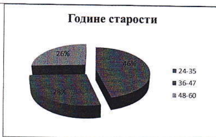
Графикон 1: Структура узорка према годинама старости

Како је приказано у Графикону 1, највећи број испитаника чине млађи наставници старости 24-35 година (46%) и 36-47 година (28%), а најмање је наставника старости 48-60 година (26%).